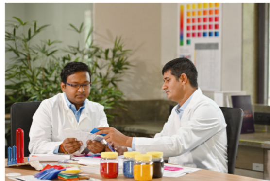
Servicio de combinación de colores

Coroplast es conocido por garantizar una calidad excepcional y una consistencia entre lotes, lo que se consigue gracias a sus laboratorios de calidad y análisis de última generación.