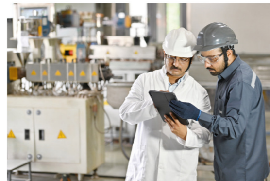
Servicio de simulación de aplicaciones